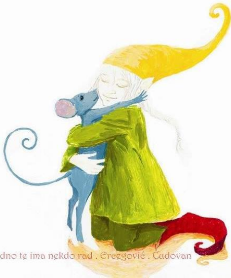
Vedno te ima nekdo rad . Ercegović . Čudovan